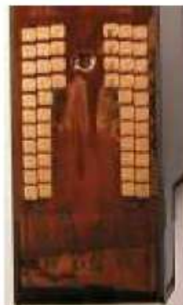
alte Version, abklebbar

Häufig erkennt der Drucker nicht, daß die Patrone wiederbefüllt wurde. Wenn der Abklebetrick nicht funktioniert, oder die Patrone eine andere Kontaktplatte aufweist, als die abklebbaren, bleibt Ihnen nach dem aktuellsten Wissensstand nur noch der "3-Patronen-Trick" (siehe Meldung „Patrone leer“).