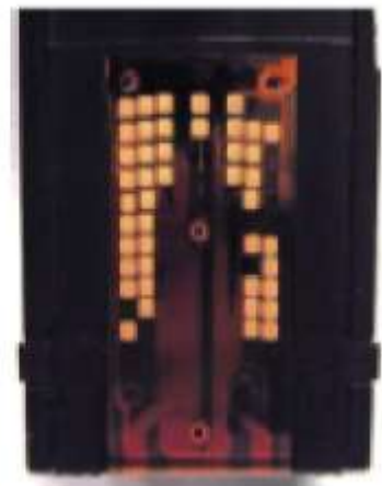
neue Version, unbekannt